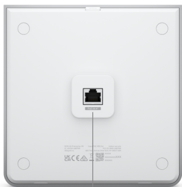
2.5 GbE, PoE+/PoE++ in RJ45 port