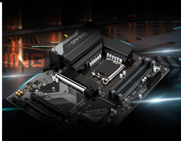
GIGABYTE B760 GAMING X DDR4