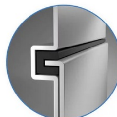
Sealed Lock-and-Key Design

Na zadní straně je k dispozici celá řada portů, mezi nimiž vyčnívá především rozhraní HDMI 2.0 , které zajistí snadné promítání 4K obsahu při vyšším jasu a kontrastu oproti standardnímu rozlišení. Jas je klíčem k viditelnosti. I proto nabízí projektor BenQ LU9245 funkci dynamického tlumení jasu dle scény a optimalizuje světelný výkon a kontrast pro co nejlepší obraz.