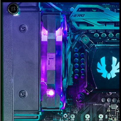
120mm ( radiator )